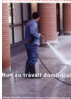
Non au travail dominical

☒ Cette mesure aura un effet nul sur la croissance, car l'argent dépensé le dimanche ne le sera pas le reste de la semaine.